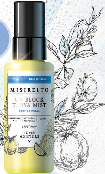
ミシレルト UVブロック TSUYAミスト 70mL (定価) ¥6,160 (税込)